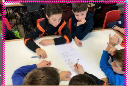
Sensibilisation arbitrage - US Saint-Flour

N'hésitez pas à nous faire parvenir vos photos à l'adresse suivante : remi.paire@auverfoot.fr