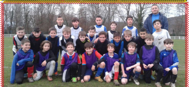
Environnement et Fair-Play - Cébazat Sports