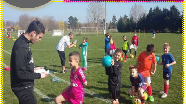
À la découverte de l'eau - FC Cournon