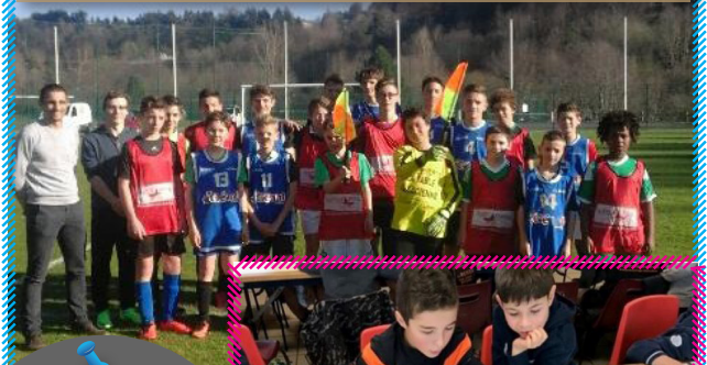
Sensibilisation arbitrage - AS Mazet/Chambon

N'hésitez pas à nous faire parvenir vos photos à l'adresse suivante : remi.paire@auverfoot.fr