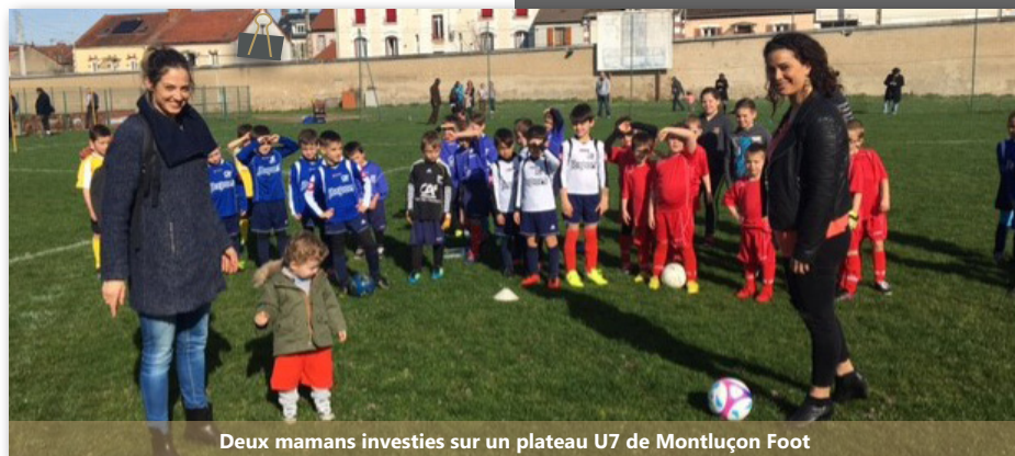
Deux mamans investies sur un plateau U7 de Montluçon Foot

Toujours à l'occasion de la journée de la femme, le District a invité les mamans ou autre femmes à venir assister l'éducateur ou l'éducatrice lors des plateaux U7 et U9 à travers l'opération